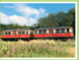
Triebwagen der Flachstrecke

Die Oberweißbacher Berg- und Schwarzatalbahn erschließt das schöne Schwarzatal und die angrenzenden Höhenlagen mit allen touristischen Angeboten der Region. Das Streckennetz umfasst drei Teilstrecken: die Schwarzatalbahn zwischen Rottenbach und Katzhütte, die 1,38 km