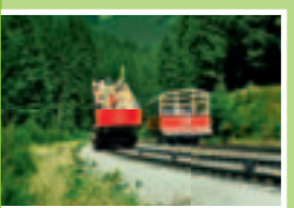
An der Ausweichstelle.

Das Herzstück, die Standseilbahn, wurde ursprünglich zum Transport von Güterwagen vom Tal auf die Hochebene gebaut. Heute ist sie ein touristischer Magnet mit Aussichtsgarantie. Denn mit 25% Steigung überwindet diese einzigartige Standseilbahn einen Höhenunterschied von 323 m.